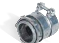
вводные муфты с крепежным хомутом для металлорукава и трубы