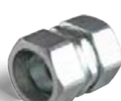
соединительные муфты «труба-металлорукав»