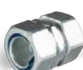
соединительные муфты «металлорукав-металлорукав»