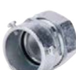
соединительные муфты винтовые «труба-металлорукав»