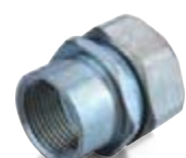
соединительные муфты резьбовые «труба-металлорукав»