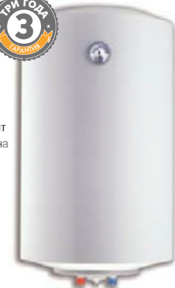
Ø438 СТАНДАРТНАЯ МОДЕЛЬ