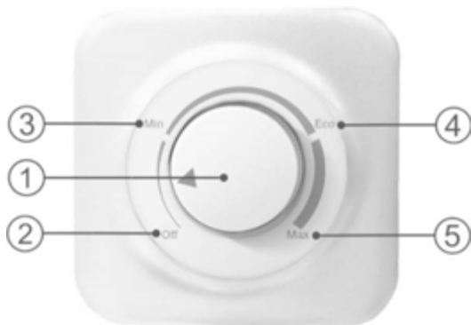
Рисунок 2. Механическая панель управления

Рисунок 2: 1 – ручка управления водонагревателем со стрелкой индикатором, 2 – зона «off» включения/выключения водонагревателя, 3 – зона регулировки температуры «min», 4 – зона регулировки температуры «eco», 5 – зона регулировки температуры «max».