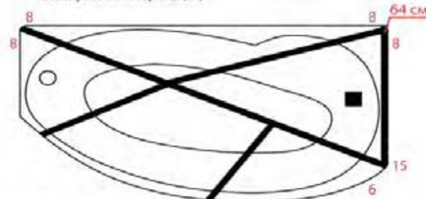
Схема установки каркаса (см)