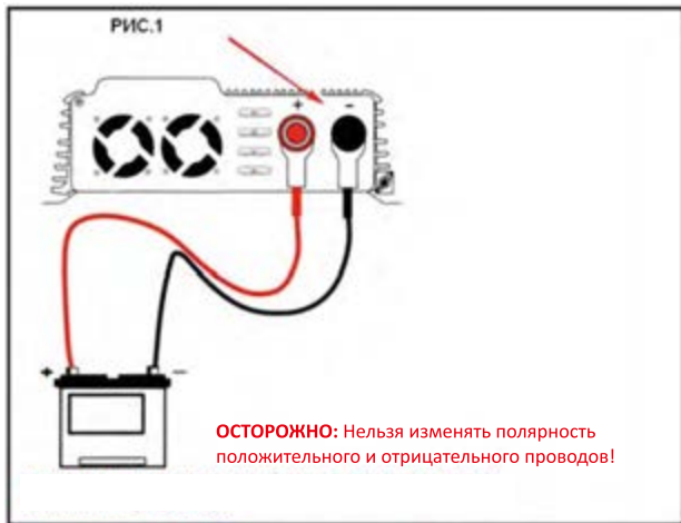
РИС.1: Подключите преобразователь к аккумулятору, используя красный провод на плюсовой вывод аккумулятора, чёрный провод к минусу источника электропитания. Крепко закрепите провода. Внимательно проверьте, чтобы клеммы «+» и «-» были закреплены согласно рисунку «РИС.1».

ОСТОРОЖНО: ПЕРЕД ПОДКЛЮЧЕНИЕМ УБЕДИТЕСЬ, ЧТО ИНВЕРТОР ВЫКЛЮЧЕН.