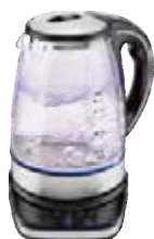
Чайник HOLT HT-KT-017