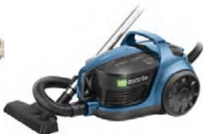
Пылесос HOLT HT-VC-009