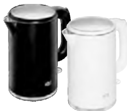
Чайник HOLT HT-KT-020 белый, черный