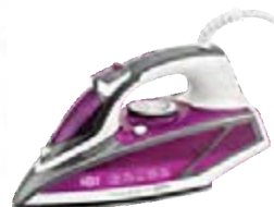
Утюг HOLT HT-IR-013