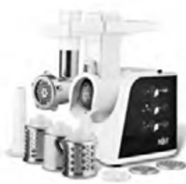
Кухонный комбайн HOLT HT-FP-003