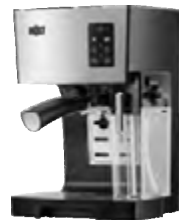
Кофеварка HOLT HT-CM-006