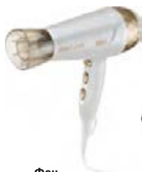
Фен HOLT HT-HD-006