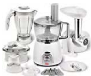
Кухонный комбайн HOLT HT-FP-004