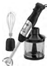
Блендер HOLT HT-BL-008