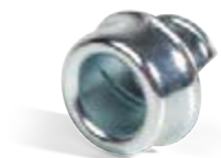
оконцеватели защитные для металлорукава