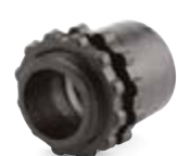
вводные муфты для металлорукава пластиковые