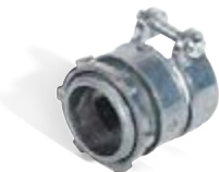
вводные муфты с крепежным хомутом для металлорукава и трубы