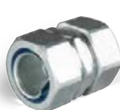
соединительные муфты «металлорукав-металлорукав»