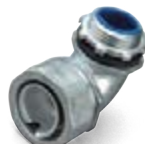
вводные муфты для металлорукава