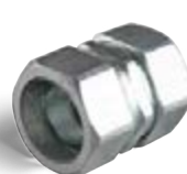
соединительные муфты «труба-металлорукав»