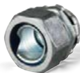
вводные муфты для металлорукава