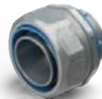
вводные муфты для металлорукава