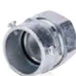
соединительные муфты винтовые «труба-металлорукав»