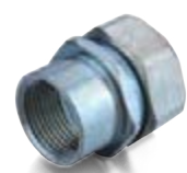
соединительные муфты резьбовые «труба-металлорукав»