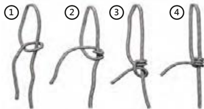
Рис. 3 Схема завязывания узла на перемычке санок.

Внимание! Паспорт следует хранить в течение всего срока службы санок.