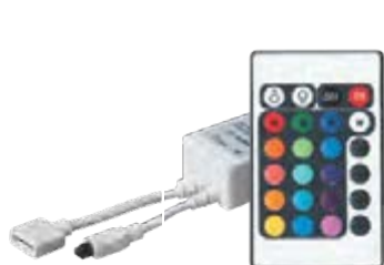
Контроллер RGB 1000RC

Тип управляющего сигнала отличается у разных моделей контроллеров jazzway : инфракрасный, радиочастотный, высокочастотный.