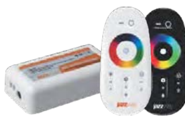
Контроллер RGB 4000HF