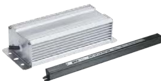
Драйверы IP67 влагозащищенные в алюминиевом корпусе (DC 12В)