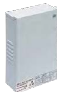
Драйвер IP45 брызгозащищенный (DC 12В)