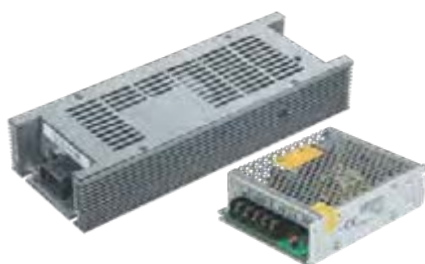
Драйверы IP20 (DC 12В)

Блоки питания jazzway предназначены для энергоснабжения светодиодных систем. Блоки питания для светодиодов различных мощностей могут быть герметичные или негерметичные, с защитой от перенапряжения, с корректировкой мощности, что существенно увеличивает срок службы светодиодных изделий. Номинальное выходное напряжение блоков питания – 12 В.