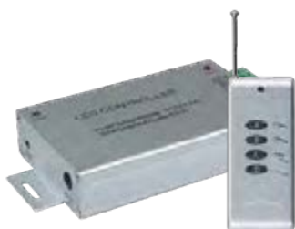
Контроллер RGB 2000RC