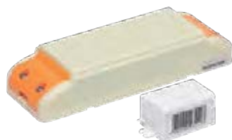
Драйверы IP20 в пластиковом корпусе (DC 12В)