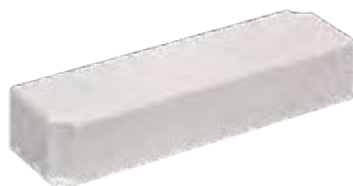
Драйвер IP67 влагозащищенный в пластиковом корпусе (DC 12В)