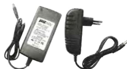
Адаптеры 12В (12W, 24W, 36W, 48W)