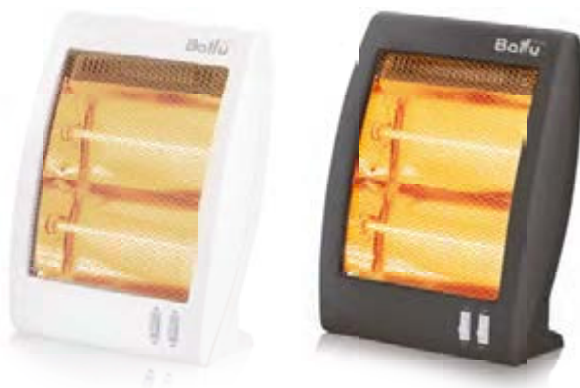
ВНН/М-09N | ВНН/М-10