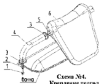
Схема №4. Крепление подголовника.