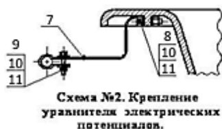
Схема №2. Крепление уровнителя электрических потенциалов.