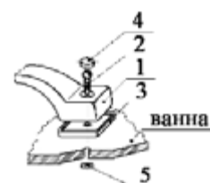
Схема №3. Крепление ручек.