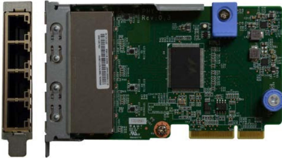
Figure 5. ThinkSystem 1Gb 4-port RJ45 LOM

Tip: Ports are numbered sequentially starting with Port 1 at the top of the adapter (furthest away from the edge connector)