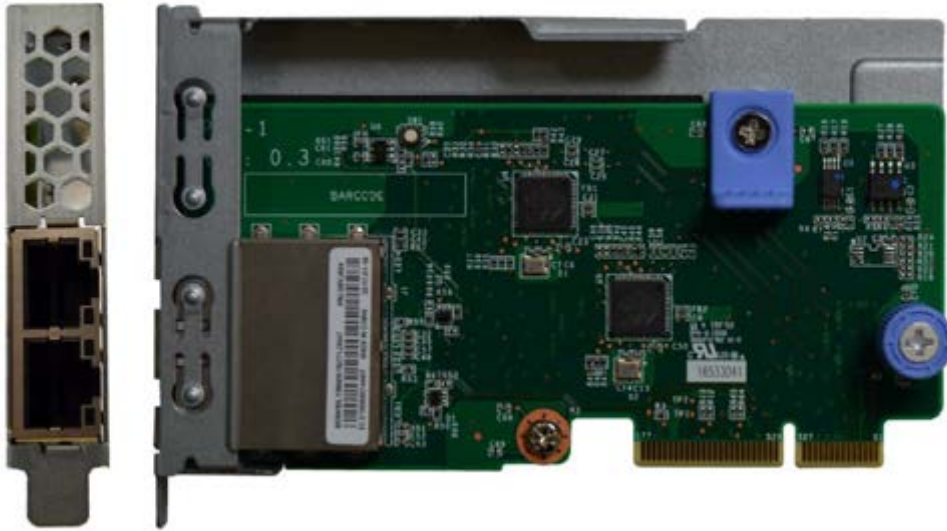
Figure 6. ThinkSystem 1Gb 2-port RJ45 LOM

Tip: Ports 1 is at further away from the edge connector and Port 2 is at the bottom, closer to the edge connector.