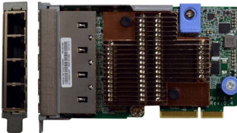
Figure 2. ThinkSystem 10Gb 4-port Base-T LOM

Tip: Ports are numbered sequentially starting with Port 1 at the top of the adapter (furthest away from the edge connector)