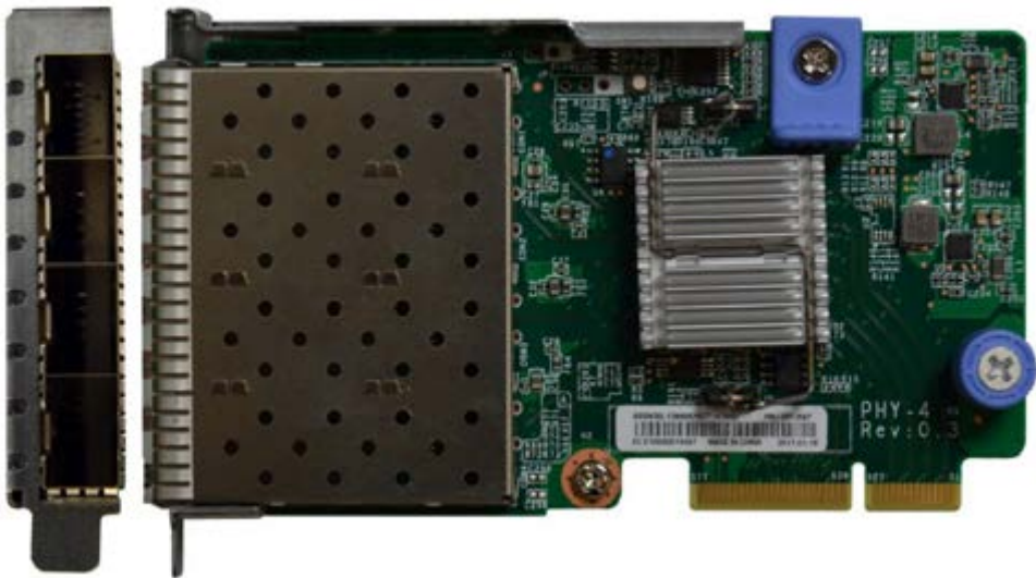
Figure 1. ThinkSystem 10Gb 4-port SFP+ LOM adapter (Port 1 at the top)

The following figure shows the ThinkSystem 10Gb 4-port SFP+ LOM adapter which provides four SFP+ cages for optical or direct-attach copper (DAC) connectivity.