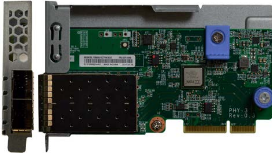
Figure 4. ThinkSystem 10Gb 2-port SFP+ LOM adapter

Tip: Ports 1 is at further away from the edge connector and Port 2 is at the bottom, closer to the edge connector.