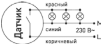
Схема подключения датчика:

Кроме того, на некоторых датчиках предусмотрена 4 клемма для подключения заземления PE.