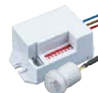
NS-IRM09-WH 800 Вт, IP65, 360°, 8 м