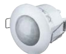
NS-IRM07-WH 1200 Вт, IP33, 360°, 6 м