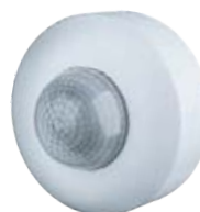
NS-IRM08-WH 1200 Вт, IP33, 360°, 12 м