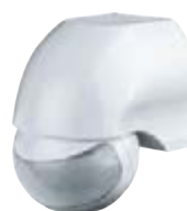
NS-IRM06-WH 1200 Вт, IP44, 180°, 12 м