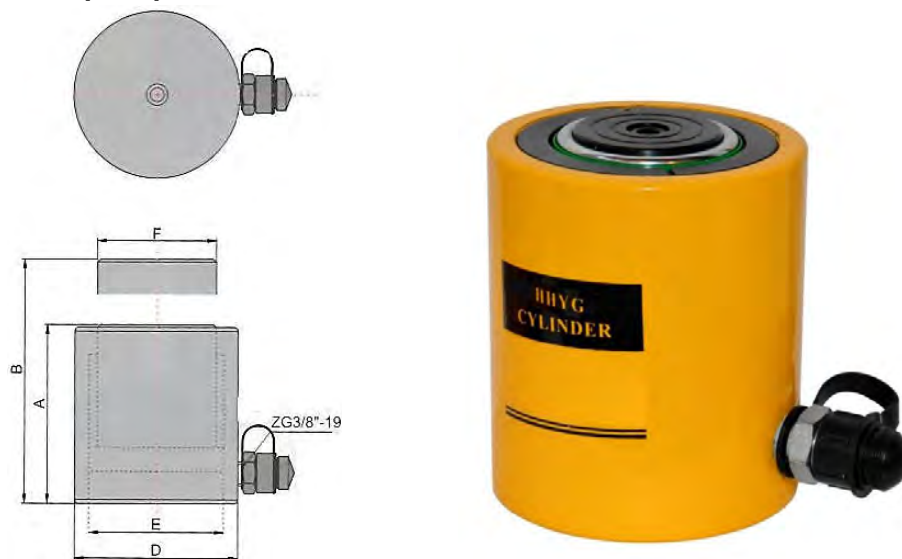
Рисунок 1. Домкрат гидравлический ННУГ.