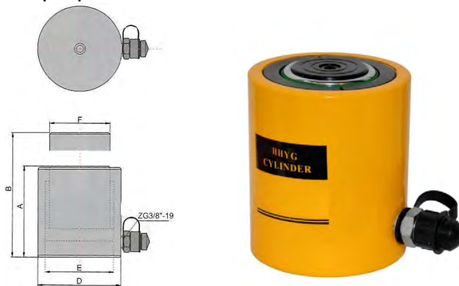
Рисунок 1. Домкрат гидравлический ННУГ.