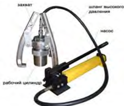
Рисунок 1. Сборочные детали магнитного захвата