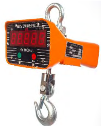
Рисунок 2. Общий вид весов крановых OCS

Общий вид весов представлен на рисунке 2.