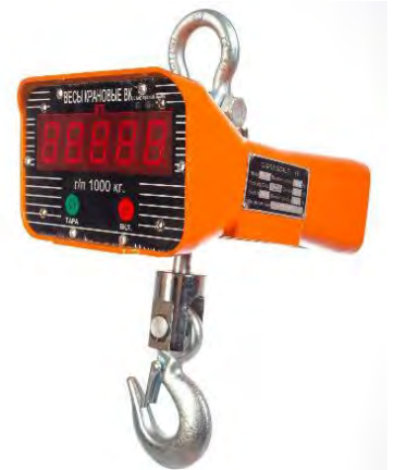
Рисунок 2. Общий вид весов крановых OCS

Общий вид весов представлен на рисунке 2.