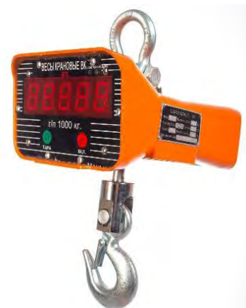
Рисунок 2. Общий вид весов крановых OCS

Общий вид весов представлен на рисунке 2.