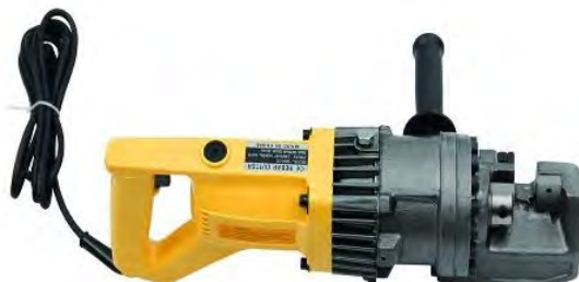
Рисунок 2. HHG-20D