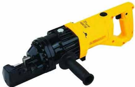
Рисунок 1. HHG-16D