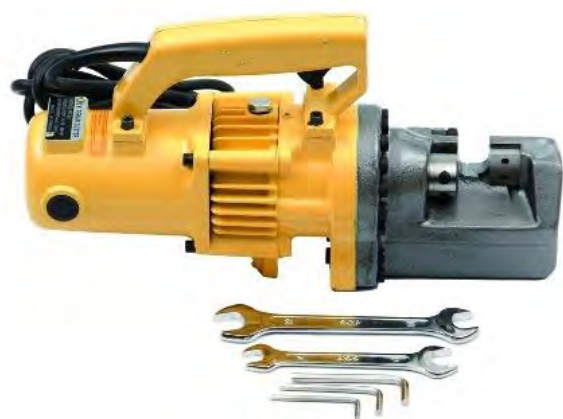
Рисунок 3. HHG-22D