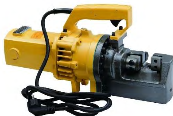
Рисунок 4. HHG-25D