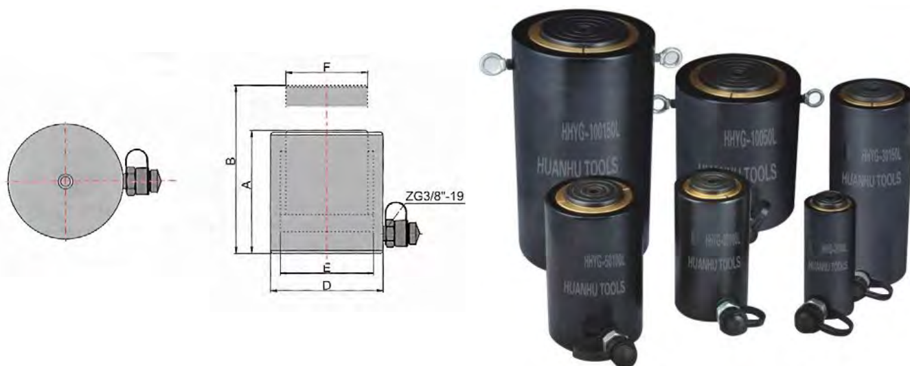
Рисунок 1. Домкрат гидравлический алюминиевый HNYG-L.