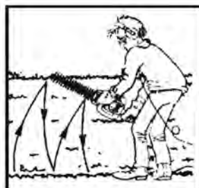
Рис. 2 Движения ножницами при обрезке