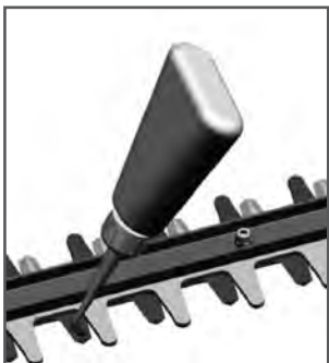
Рис. 3 Смазка режущих ножей

Смазка ножей производится после каждых 4 часов работы. Нанесите (распылите) несколько капель машинного масла на поверхность ножей (Рис. 3).