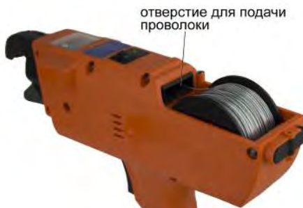
отверстие для подачи проволоки