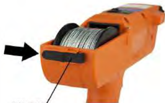
защелка крышки катушки