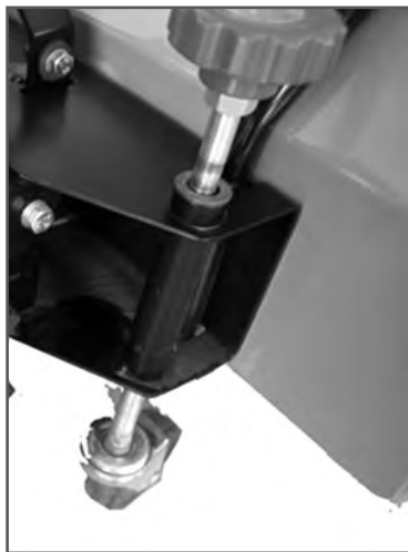
Рис. 4 Винт регулировки высоты подъема опоры дополнительных колес

Остальные действия производите в соответствии с руководством по эксплуатации машины подметально-уборочной CHAMPION GS5562.