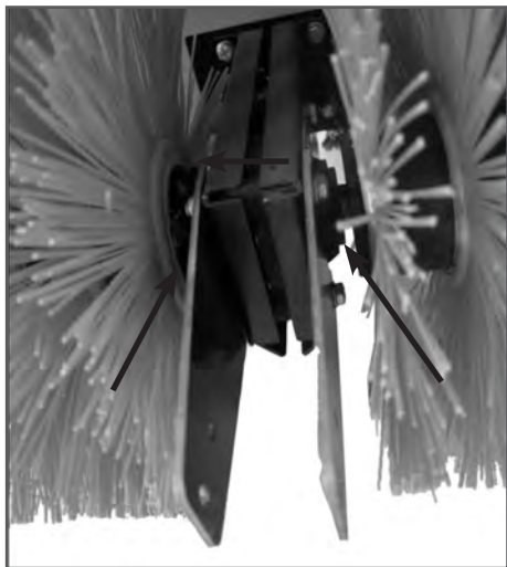
Рис. 1 Установка соединительных пластин крепления отвала

Установите две соединительные пластины на корпус редуктора щетки (Рис. 1).