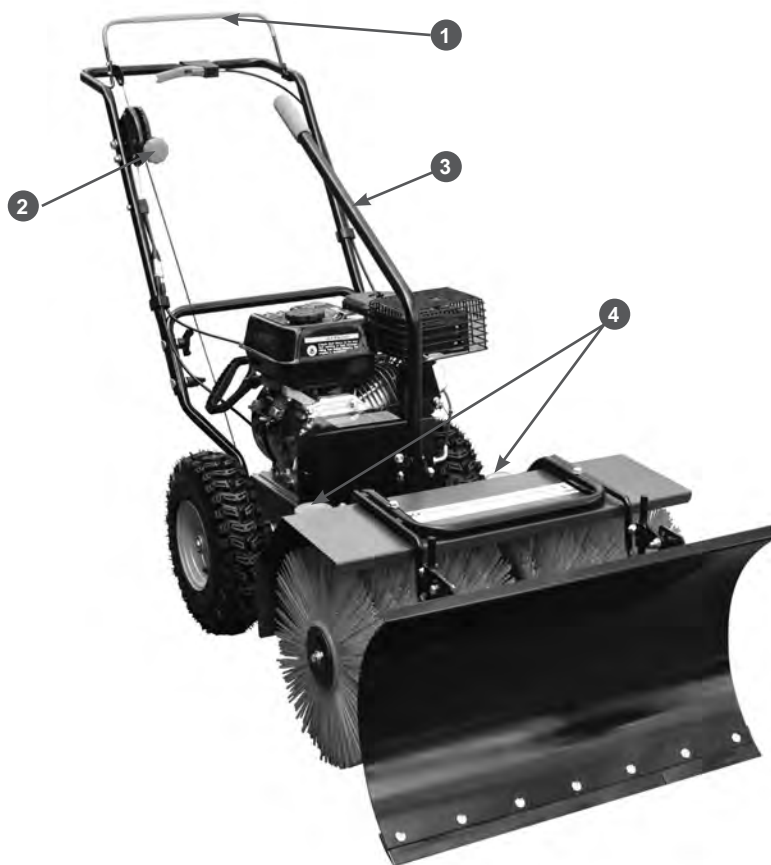
Рис. 5 Основные узлы и органы управления машины