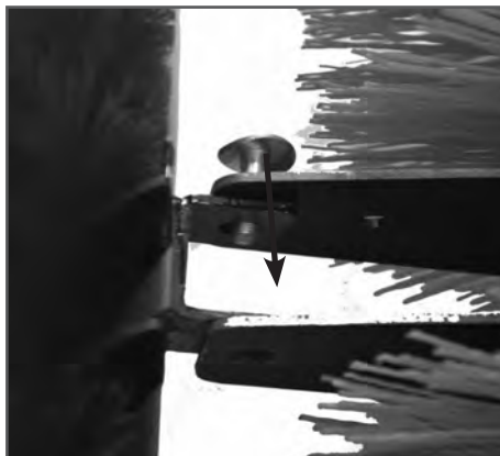
Рис. 3 Соединение отвала и соединительных пластин

Закрепите отвал двумя болтами М8*25 (Рис. 3).