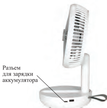
Разъем для зарядки аккумулятора

Зарядка осуществляется от USB. Для зарядки подходит шнур USB-C. Разъем для зарядки находится на правой стороне подставки вентилятора. Вставьте один конец шнура в разъем для зарядки аккумулятора, а другой подсоедините к источнику питания. Для зарядки устройства рекомендуется использовать блок питания с USB-разъемом и выходными параметрами: \approx 5 В, 2 А.