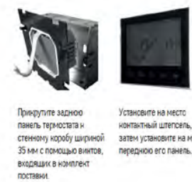
Прикрутите заднюю панель термостата к стенному коробу шириной 35 мм с помощью винтов, входящих в комплект поставки.