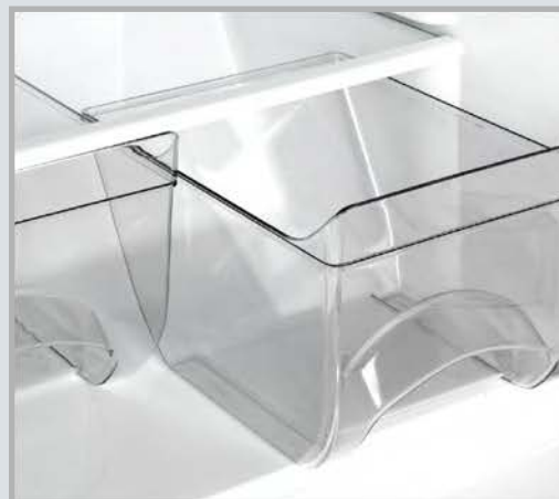
Два сосуда для овощей и фруктов