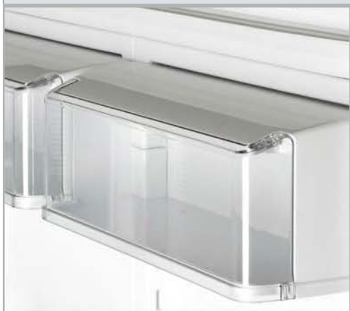
Две ёмкости с крышкой

ЭЛЕМЕНТЫ УПРАВЛЕНИЯ И КОМФОРТНОСТИ В ХОЛОДИЛЬНОЙ КАМЕРЕ