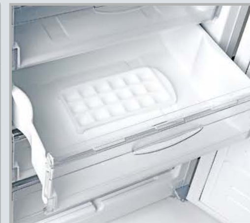
Корзина с формой для льда

Ролик регулировки температуры в морозильной камере