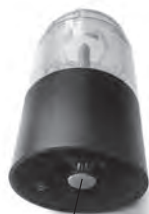
Винт для регулировки степени помола