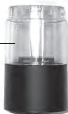
Стакан для специй