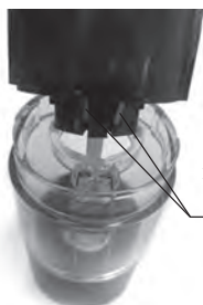
Штырьки на моторном блоке