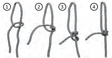
рис. 2 Схема завязывания узла на перемычке санок.