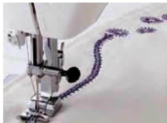
➤ Лапка для пришивания шнура и нити-резинки