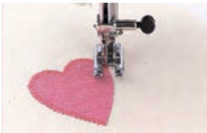
➤ Лапка для аппликаций с открытым мыском