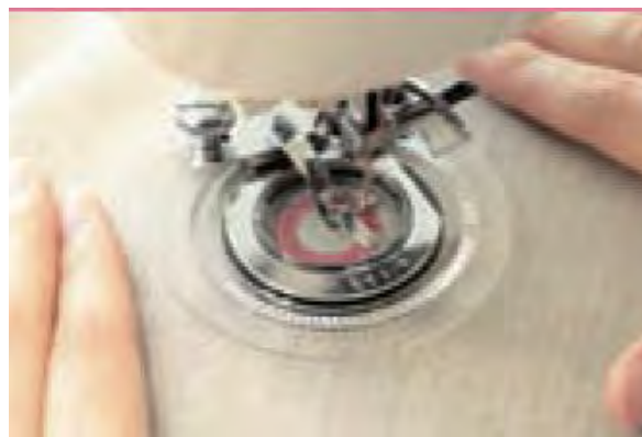
➤ Лапка для создания цветочных узоров