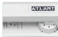
Ролик регулировки температуры в морозильной камере