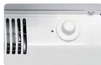
Ручка регулировки температуры в холодильной камере