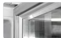
Однокамерный стеклопакет двери

В холодильниках с электронным блоком управления показания температуры отображаются на цифровом индикаторе.