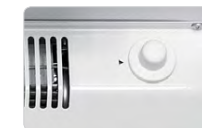
Ручка регулировки тем- пературы в холодильниках без электронного блока