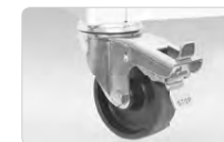
Колесные поворотные опоры

В холодильнике для удобства перемещения внутри торгового зала предусмотрена установка колесных поворотных опор, которые входят в комплект поставки в зависимости от исполнения модели.