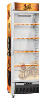
Размещение рекламной информации на холодильнике

В холодильнике для удобства перемещения внутри торгового зала предусмотрена установка колесных поворотных опор, которые входят в комплект поставки в зависимости от исполнения модели.