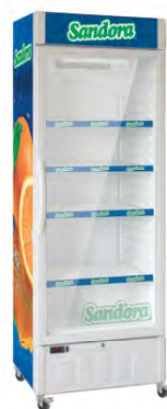
Размещение рекламной информации на холодильнике

В холодильниках с электронным блоком управления показания температуры отображаются на цифровом индикаторе.