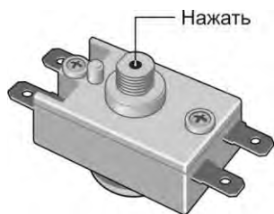
Рисунок 3. Расположение штока на термовыключателе.

При превышении температурой воды значения +95^{\circ}\text{C} срабатывает термовыключатель, экстренно отключающий ТЭН. Для возврата прибора в рабочее состояние необходимо нажать до щелчка штока термовыключателя ( Рис.3 ), который расположен под защитной крышкой ЭВН.