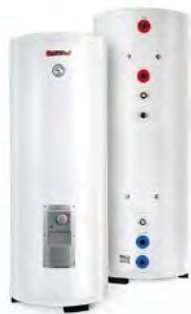
Комбинированные (кос- венные) водонагреватели