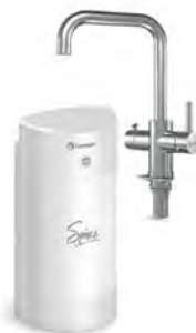
Мультипот система кипячения питьевой воды