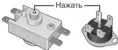
Рисунок 3. Возможные схемы расположения кнопки термовыключателя

При проведении технического обслуживания ЭВН силами специализированной организации в сервисном талоне должна быть сделана соответствующая отметка.