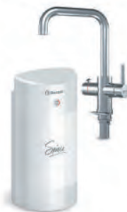
Мультипот система кипячения питьевой воды