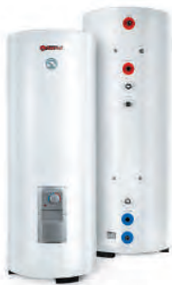
Комбинированные (коч- венные) водонагреватели