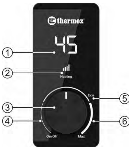
Рисунок 2. Панель управления

Рисунок 2: 1 – LED индикация температуры нагрева, 2 – индикация режима нагрева, 3 – регулятор температуры, 4 – зона «On/Off» / включение/выключение, 5 – зона режима «Eco», 6 – зона режима «Max».