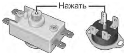
Рисунок 3. Возможные схемы расположения кнопки термовыключателя

Вышеперечисленные неисправности не являются дефектами ЭВН и устраняются потребителем самостоятельно или за его счет.