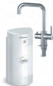
Мультипот система кипячения питьевой воды