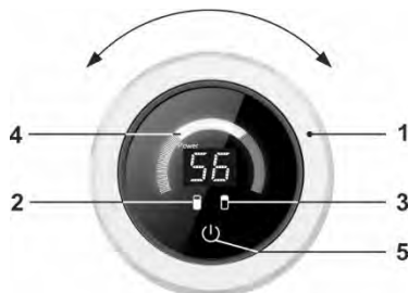
Рисунок 1. Панель управления

На электрическом шнуре ЭВН смонтировано устройство защитного отключения (УЗО), обеспечивающее отключение ЭВН от сети электропитания при появлении тока утечки на заземлённых элементах электроприбора.