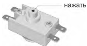
Рисунок 3. Расположение кнопки термовыключателя.

Вышеперечисленные неисправности не являются дефектами ЭВН и устраняются потребителем самостоятельно или силами специализированной организации за его счёт.