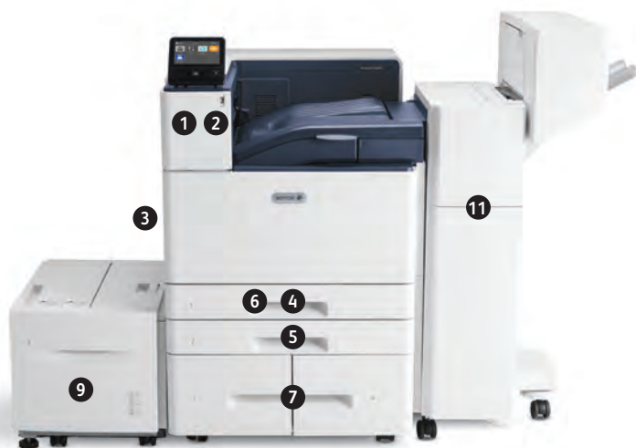
Цветной принтер Xerox® VersaLink® C8000 Печать. Мобильное подключение.