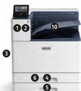
Xerox® VersaLink® C8000 и C9000 Стандартная конфигурация