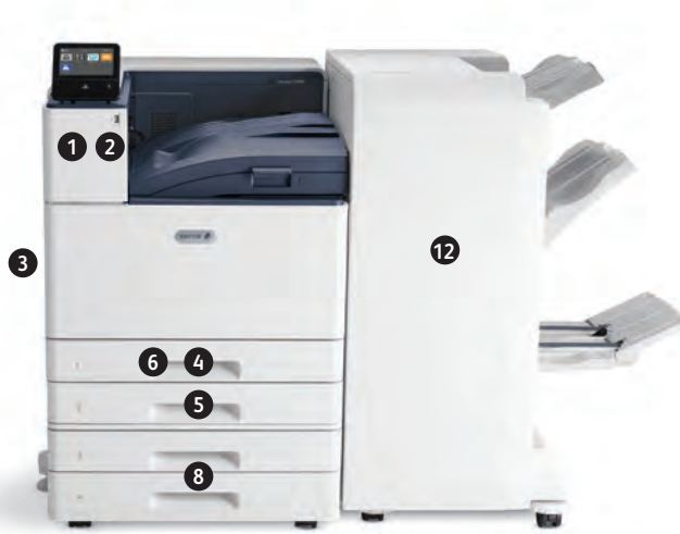
Цветной принтер Xerox® VersaLink® C9000 Печать. Мобильное подключение.