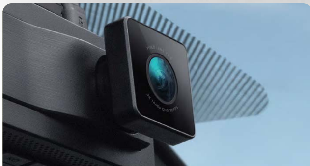
1. Фронтальная камера