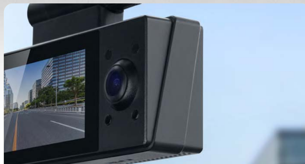
2. Салонная камера