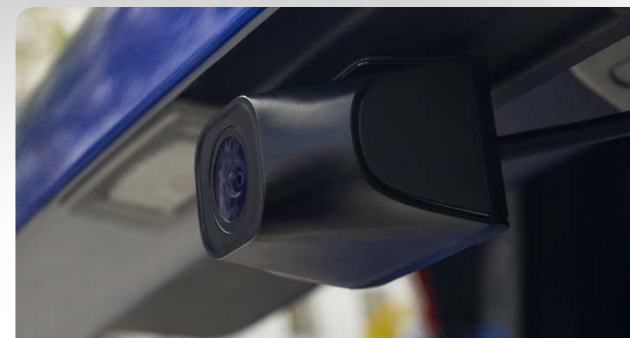
3. Задняя камера (только в G-Tech X63)