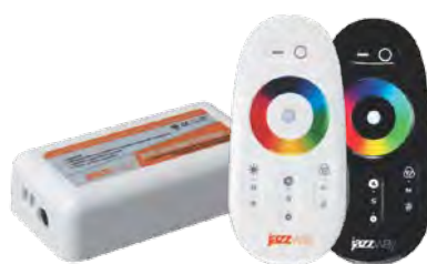
Контроллер RGB 4000HF