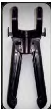
Складная вешалка с 2 зажимами