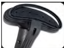
Зажим для отпаривания стрелок на брюках