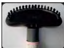
Насадка-щетка для отпаривания одежды, полотенец, постельного белья