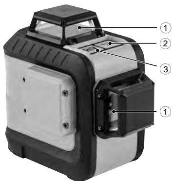
LX-360-2 Red (арт. 35076)