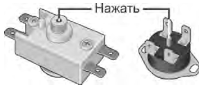
Рисунок 3. Схема расположения кнопки термовыключателя

Вышеперечисленные неисправности не являются дефектами ЭВН и устраняются потребителем самостоятельно или за его счет.