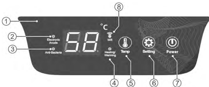
Рисунок 2. Электронная панель управления

Рисунок 2: 1 – LED дисплей, 2 – индикация «Electronic Anode», 3 – индикация «Anti-Bacteria», 4 – индикация «Heating/Warming», 5 – кнопка «Temp», 6 – кнопка «Setting», 7 – кнопка «Power», 8 – индикация «Wi-Fi».