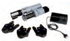
RP200-1 Комплект пресс-инструмента, аккумуляторный