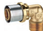
RM127 Угольник с наружной резьбой