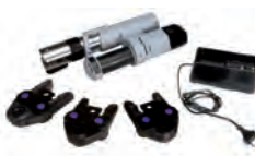
RP200-1 Комплект пресс-инструмента, аккумуляторный