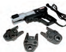
RP200 Комплект пресс-инструмента, 220 Вт