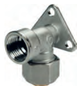
R572AM Угольник установочный с внутренней резьбой