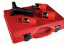
PR209R Калибратор/очиститель для металлополимерных труб