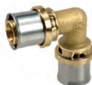
RM122 Угольник 90°