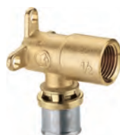
RM139 Угольник установочный с внутренней резьбой