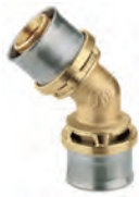
RM144 Угольник 45°