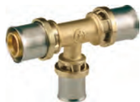
RM151 Тройник переходной