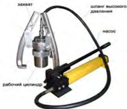
Рисунок 1. Сборочные детали магнитного захвата