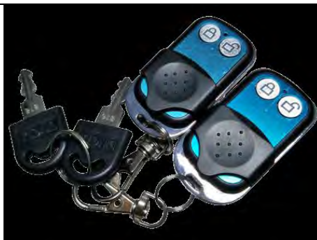
Пульт дистанционного управления + Ключ механический