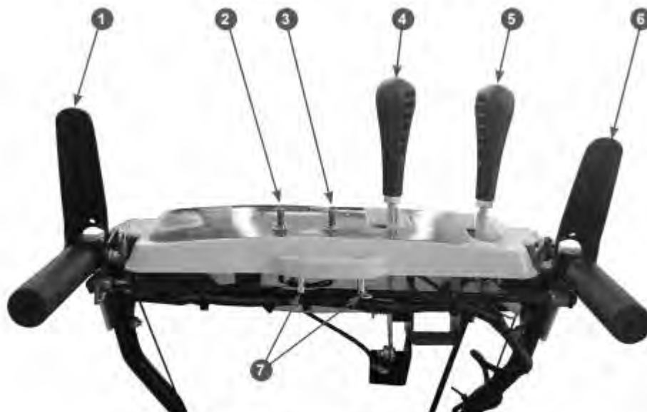
Рис. 3 Основные узлы и органы управления (вид на панель управления со стороны оператора)