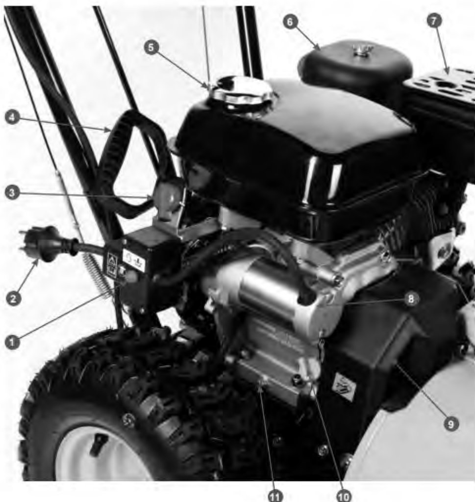
Рис. 2 Основные узлы и органы управления