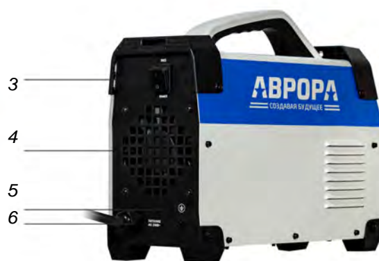
Рис.2 Задняя панель