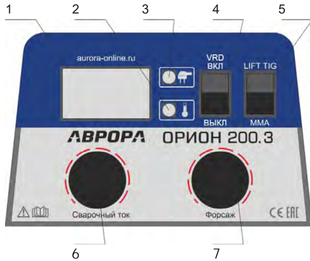
Рис.3 Панель управления