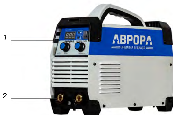
Рис. 1 Передняя панель