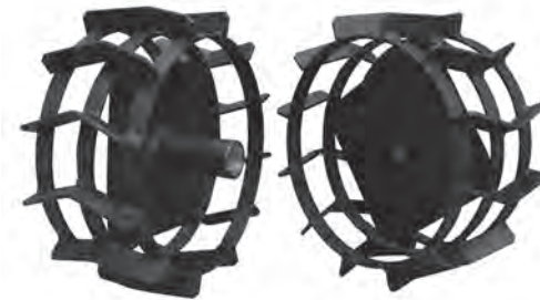
ГРУНТОЗАЦЕПЫ ШИРОКИЕ — АРТИКУЛ ДЛЯ ЗАКАЗА: C3001